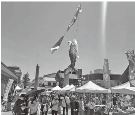
昨年のまつりの様子