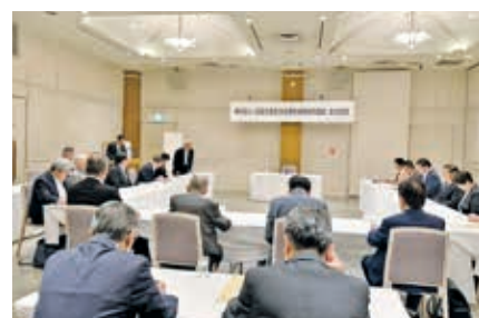
設立総会開催風景