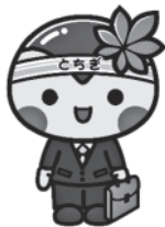
とちまるくん